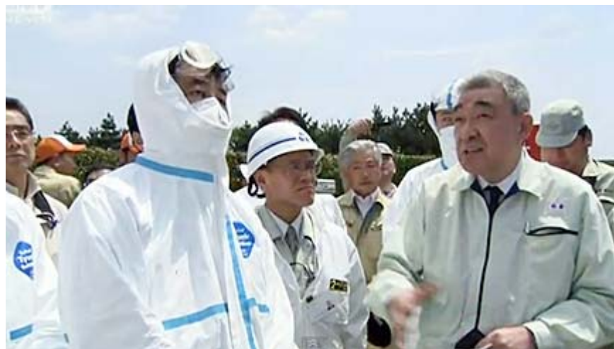
平服の化学工場社長の説明を防護服で聞く岡田幹事長 (画像クリックでyou tube動画へ)

むしろ米国が懸念しているのは、これから震災復興を手掛ける菅政権が危うい状態にあること。オバマ大統領は、普天間基地移設をはじめ、日米間の懸案を解決すると約束した菅政権が続くことを望んでいる。そのため、ホワイトハウスでは国家安全保障会議などが中心になって、日米関係を悪化させることがないように指導するオペレーションを震災後から展開している。“特別な専門家”の派遣もそのひとつと考えていい