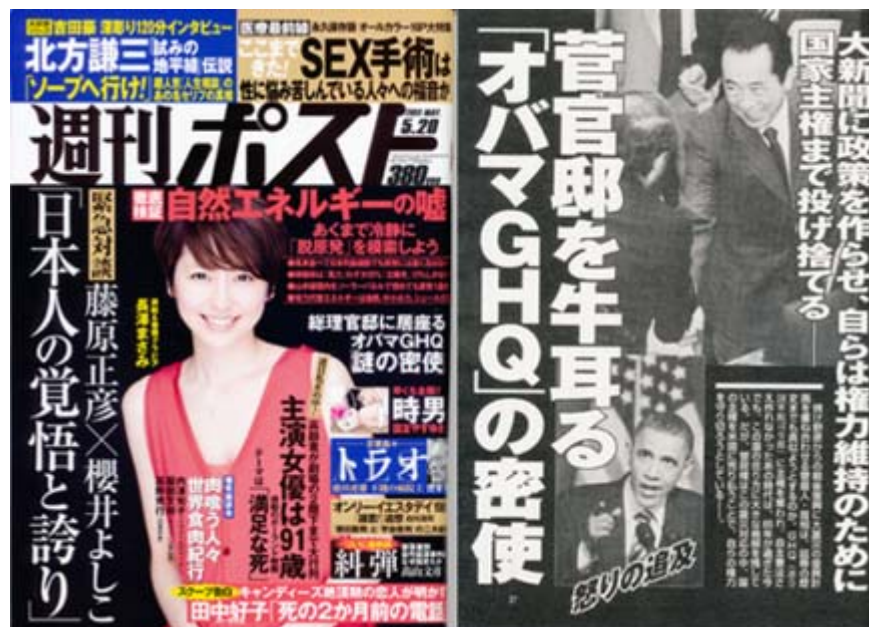
週刊ポスト5月20日号の表紙と問題の記事のトップ (画像クリックでHPに飛びます)

米国は震災直後にNRCの専門家約30人を日本に派遣して政府と東電の対策統合本部に送り込み、大使館内にもタスクフォースを設置した。3月22日に発足した日米連絡調整会議(非公開)にはルース大使やNRCのヤツコ委員長といった大物が出席し、その下に「放射性物質遮蔽」「核燃料棒処理」「原発廃炉」「医療・生活支援」の4チームを編成して専門家が具体的な対応策を練っている。