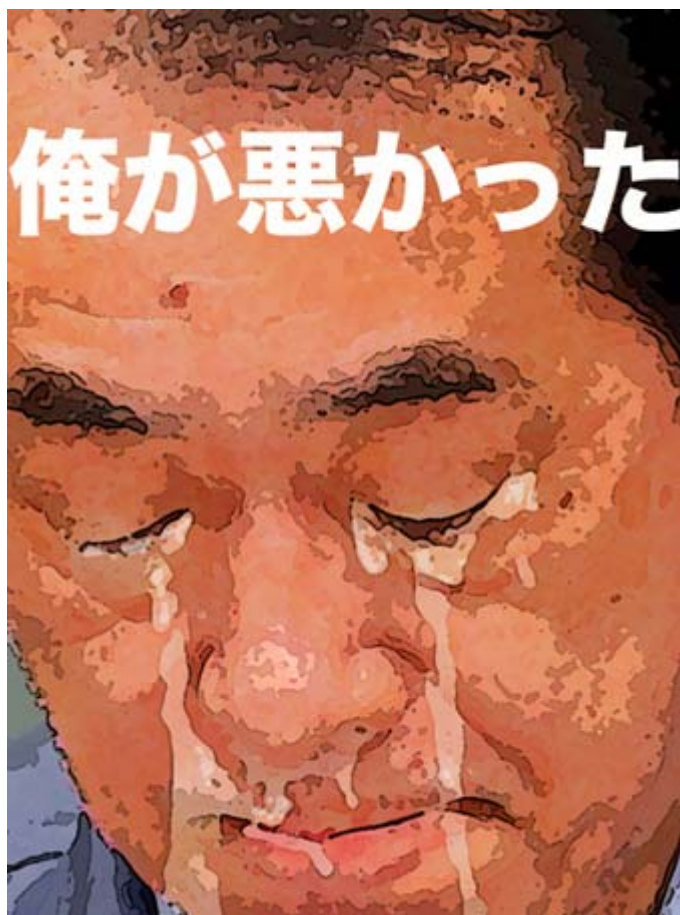
画像はyohkanさんからお借りました。