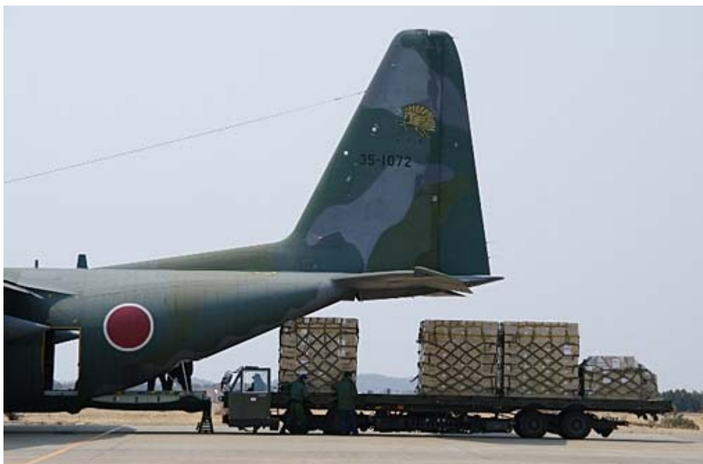
航空自衛隊の物資輸送写真

これ以上ない“総力戦”だったのである。（後略、WILL6月号P201-P204から抜粋）