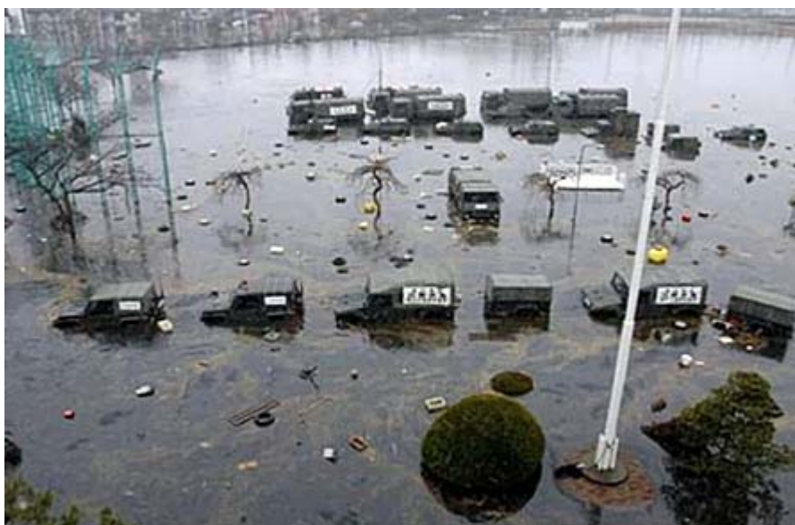
大地震発生から津波まで一時間。その間に陸自の多賀城駐屯地では災害派遣に備えて出動準備が完了していた。凄いスピードだった。その後に津波が来て車両が水に浸かったことを物語る写真。動画「東日本大震災・頑張れ被災者」から。

地震があったのが午後二時四十六分、宮城県に津波が押し寄せたのが三時五十分ごろである。つまり、地震一時間後には出動準備をすべて終えていたということだ。