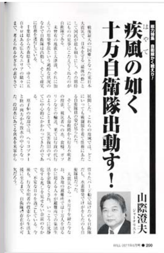
WILL6月号は定価780円で好評発売中です(クリックで目次ページへ)