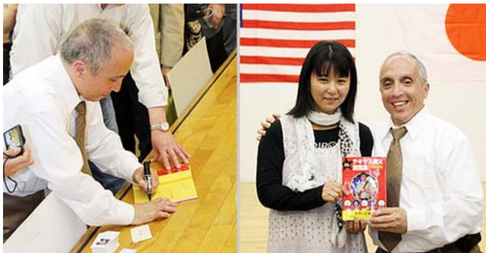
サイン会と記念撮影。彼はサウスボーなんです。

会場では「 テキサス親父演説集 」というDVD入りの本が販売され、このサイン会や記念撮影会が行われて大人気でした。一人一人との対応時間がかかり長く、おかげで終了予定時間を大幅にオーバー、完全に終わったのは午後九時過ぎでした。これから動画が次々とアップされると思います。なお、既に大阪の状況は 事務局のHP で報告されています。とりあえずのご報告でした。