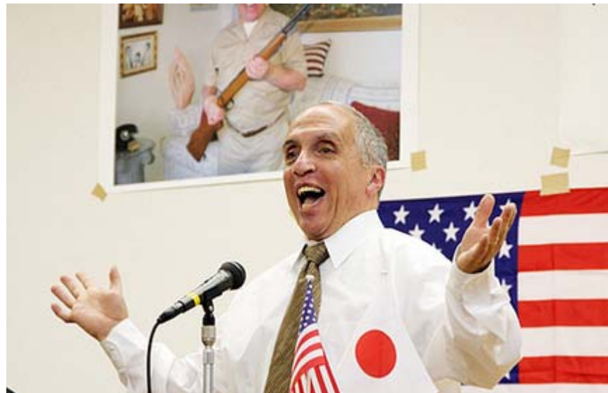
「ハア〜イ」と例の調子で挨拶したテキサス親父ことトニー・マラーノ氏。

「テキサス親父」ことトニー・マラーノ氏が11日に初来日し、大阪(14日)と東京(15日)で「講演会とファンの集い」を相次いで開催、参加者から熱狂的な歓迎を受けた。