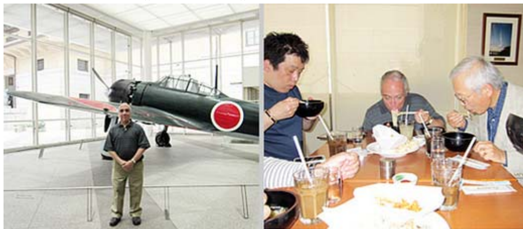
遊就館のゼロ戦前で、お箸も器用にうどんの昼食