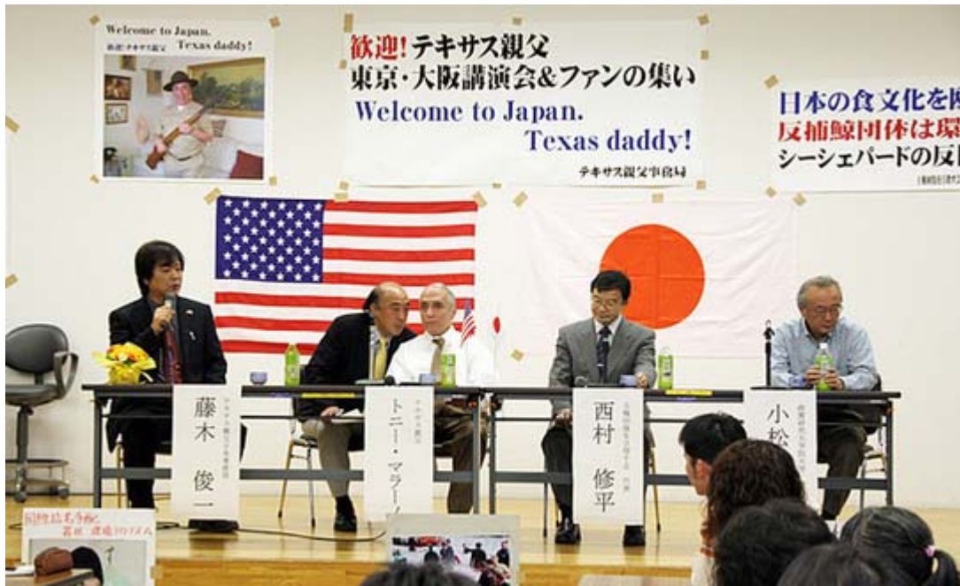
パネルディスカッションのスナップ

講演会では、初来日しての氏の日本の感想、広島や和歌山県太地町を訪れての印象やシーシェパードに対する持論、そして東日本大震災へのお見舞いや、日本人が取った冷静な行動などを賞賛、日本人の温かい歓迎に感謝する旨の話しをしていた。