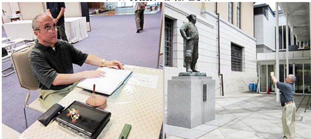
昇殿参拝のため参集殿で記帳、特攻兵士の像を撮影