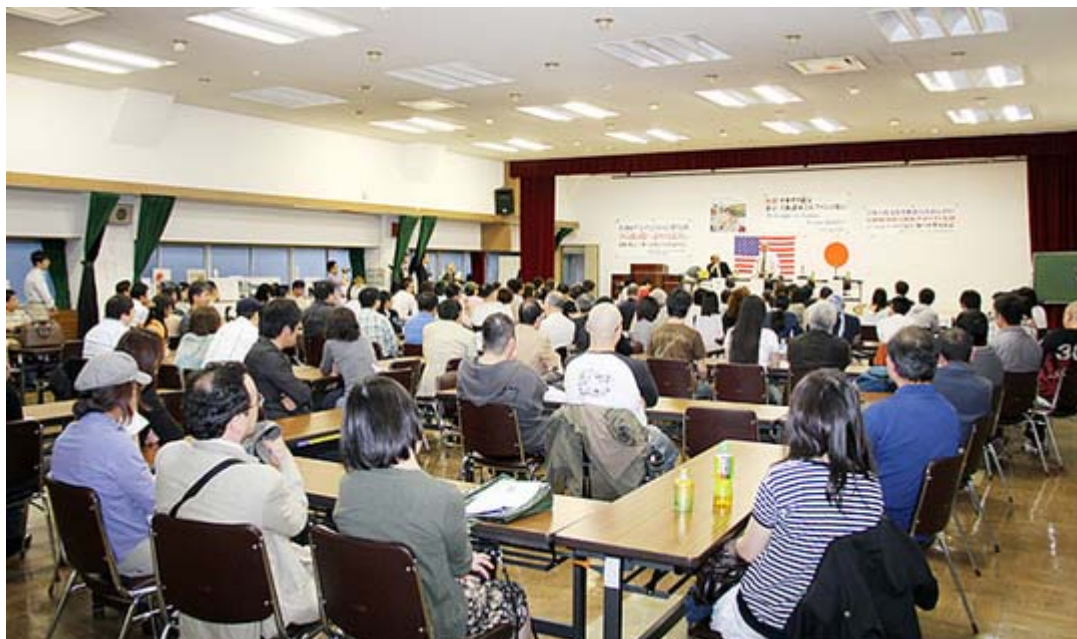
軽食のパーティーが控えているためご覧のような机の配列でした。

テキサス親父とは、Youtubeで自ら「プロパガンダ・バスター (Propaganda Buster)」と名乗るイタリア系アメリカ人男性。テキサス州在住でYouTubeへマスコミやグリーンピースなど、さまざまな話題・悪(ワル)を軽快なトークでねじ伏せる動画投稿を続けている。親日家としても有名で、日本では特に人気が高いと言われている。