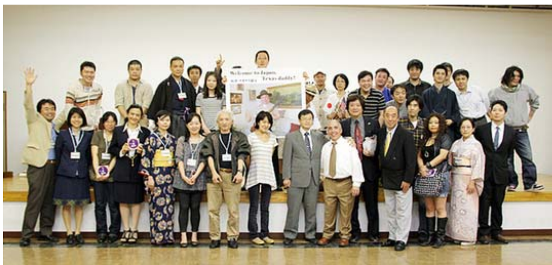
集会を裏方で支えてくれたスタッフの皆さんと最後の集合写真(午後九時過ぎ撮影)

会場では「 テキサス親父演説集 」というDVD入りの本が販売され、このサイン会や記念撮影会が行われて大人気でした。一人一人との対応時間がかかり長く、おかげで終了予定時間を大幅にオーバー、完全に終わったのは午後九時過ぎでした。これから動画が次々とアップされると思います。なお、既に大阪の状況は 事務局のHP で報告されています。とりあえずのご報告でした。