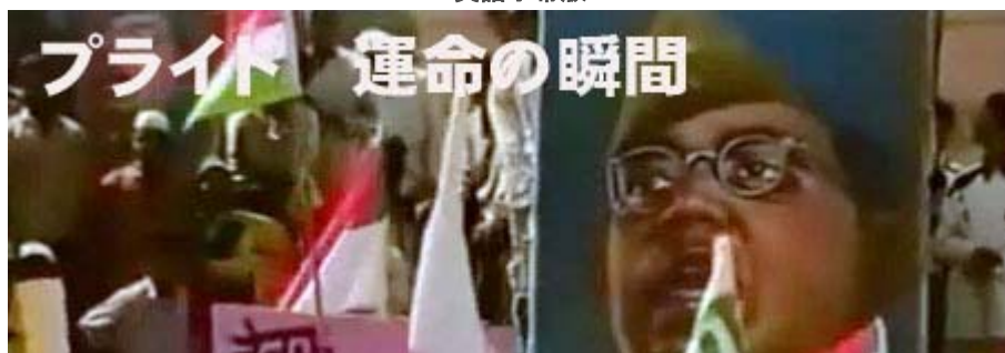
お奨めの名作です。是非ご覧下さい。