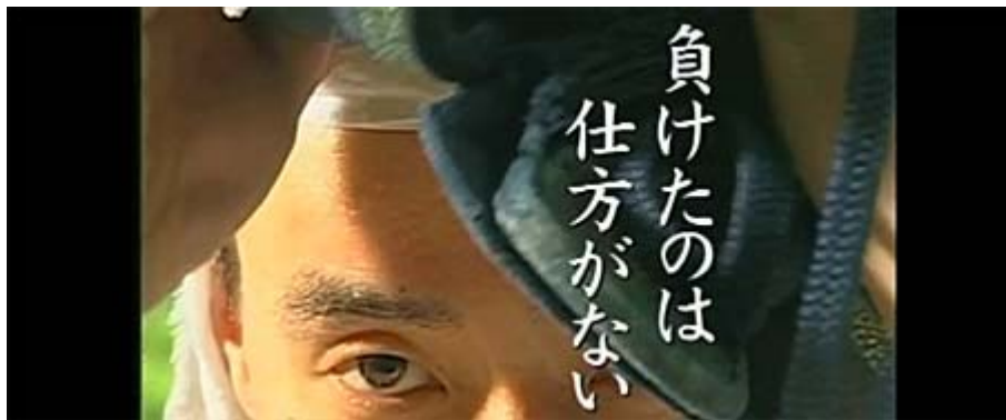
日本がアジアに残した功績