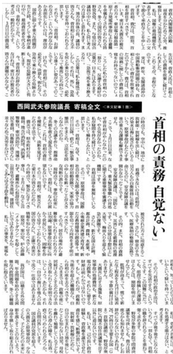
読売新聞5月19日6面の記事スキャン画像

その三。首相が、被災された東日本の皆さんのために、今の時点で、緊急になすべき事は、「8月上旬」などと言わず、避難所から 仮設住宅 、公営住宅の空き部屋、賃貸住宅、とあらゆる手段を動員し、被災された方々に用意することです。さらに、資金の手当て、医療体制の整備が急務です。