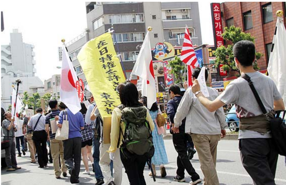
職安通りコリアタウン前を通過するデモ隊の一行

今回は、在特会に参加するのははじめて、という若い人の姿が目立ったが、デモ隊は「違法賭博パチンコ産業を日本からたたき出せ!」「警察は賭博法違反でパチンコホール全店を摘発しろ!」「多くの悲劇を生み出すパチンコを撲滅するぞ!」などと気合いの入ったシュプレヒコールを繰り返していた。