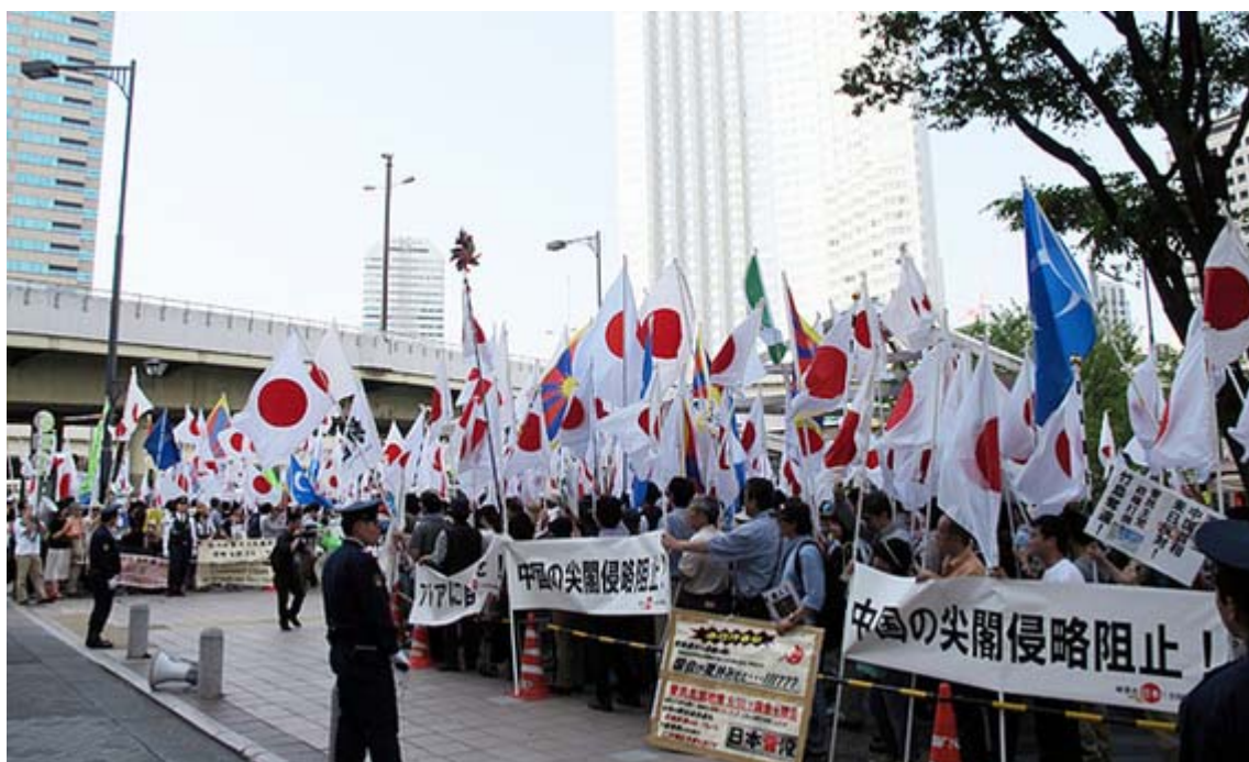
参加者が多く、三つのブロックに分かれた、左上のビルはニューオータニ新館

一方、頑張れ日本！全国行動委員会(田母神俊雄会長)も21日、「中国のアジア支配阻止！アジアに自由の砦を！国民大行動！」と銘打ち、来日した中国の温家宝首相へ抗議の街頭宣伝活動を実施した。参加者は当初は少なかったものの、その後次第に増え続け、赤坂見付では400人を超えたと見られる。