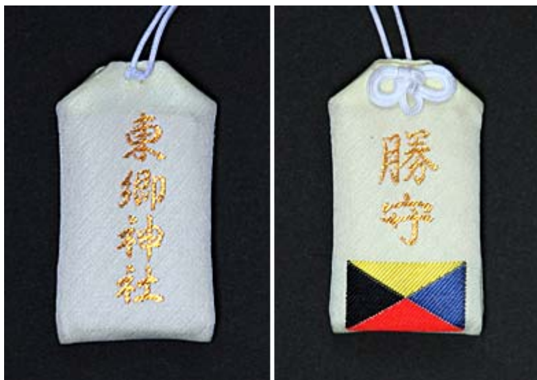
Z旗の刺繍入り勝利のお守り (東郷神社で700円で入手できます)

海上自衛隊は、礼式、号令、日課、用語などを日本海軍から継承しており、その独特の気風から伝統墨守唯我独尊ともいわれる。観閲式における海上自衛官の分列行進や自衛艦の進水、遠洋航海や南極観測への出港などの際には日本海軍伝統の軍艦行進曲(軍艦マーチ)が演奏され、海軍の軍艦旗をそのまま自衛艦旗としており、日本海海戦を記念して制定された戦前の海軍記念日(5月27日)の前後には、現在の海上自衛隊も基地祭などの祝祭イベントを設けている。