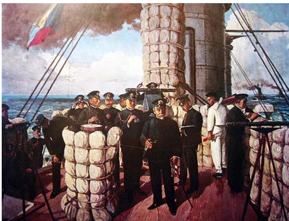
連合艦隊 旗艦三笠艦橋で指揮をとる東郷平八郎大将 (Z旗に注目！)

正確には、世界中で植民地支配を続けてきた白人キリスト教国家にとっては「信じられない悪夢」、逆に支配されてきた有色人種の人々にとっては「驚喜、奇跡の勝利」でした。おかげで、日露戦争の英雄である陸軍の乃木希典、海軍の東郷平八郎両大将の名声は世界中にとどろいたのでした。