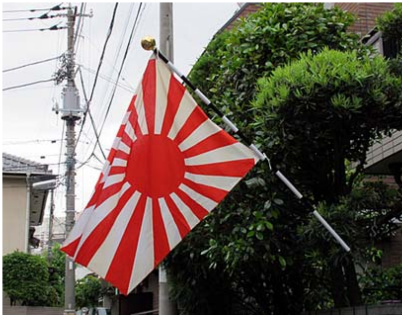
筆者自宅に掲揚した旭日旗(曇りで無風なのが残念です)

またTBしてくれた「日本の面影 ういすぱー・ぼいす」さんの映画「明治天皇と日露大戦争」の動画も併せて貼り付けました。ご指摘、ご紹介感謝します。現在は、明治の精神に還れ、 憲法 も教育勅語も復活せよ、という識者が増えていますが、本当にそう思う今日この頃です。