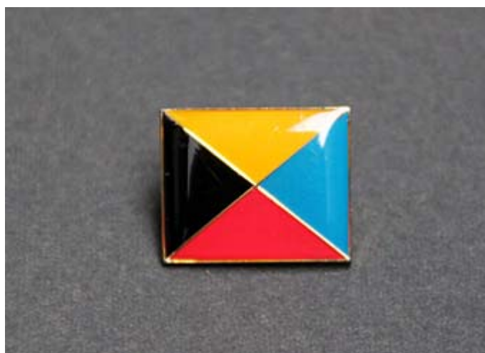
Z旗ピンバッジ(天地15ミリ 左右20ミリ) 私は横浜大棧橋のショップで500円で入手

海上自衛隊は、礼式、号令、日課、用語などを日本海軍から継承しており、その独特の気風から伝統墨守唯我独尊ともいわれる。観閲式における海上自衛官の分列行進や自衛艦の進水、遠洋航海や南極観測への出港などの際には日本海軍伝統の軍艦行進曲(軍艦マーチ)が演奏され、海軍の軍艦旗をそのまま自衛艦旗としており、日本海海戦を記念して制定された戦前の海軍記念日(5月27日)の前後には、現在の海上自衛隊も基地祭などの祝祭イベントを設けている。