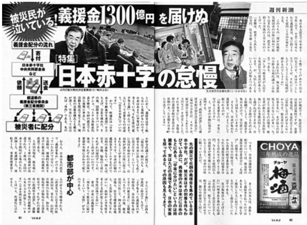
週刊新潮6月2日号P40-P41より抜粋(クリックでHP)

つまり、日赤は義援金の配分については、都道府県の義援金配分委員会に、“丸投げ”状態である。5月16日の時点で、日赤から各県の配分委員会に送られた義援金は共同募金分なども合わせて約707億円。今も1300億円以上の義援金が被災地に届けられることなく、日赤の口座に眠っているのだ。