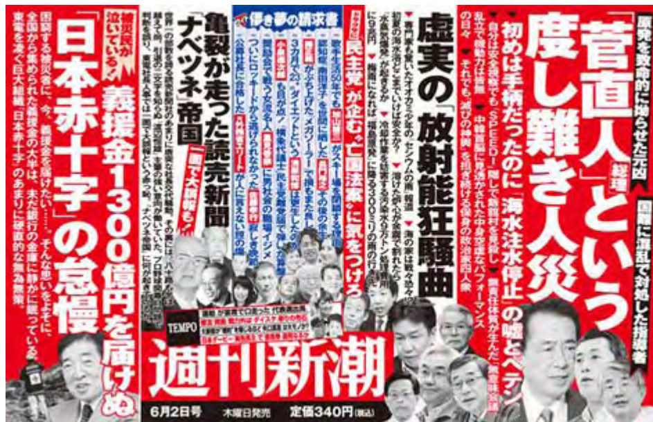
週刊新潮6月2日号中中吊り広告の画像

と思っていたら、木曜日に発売された週刊新潮がまったく同じ問題意識から、この件で4ページの特集を組んでましたので、その一部を抜粋して紹介します。結論は、「 日赤 には義援金を一刻を争って被災者に届けようという“覚悟”がない」と断じています。一刻も早く、臨機応変に届けて欲しい、「生活が出来ない」と被災者の悲鳴が上がっているのではないですか。