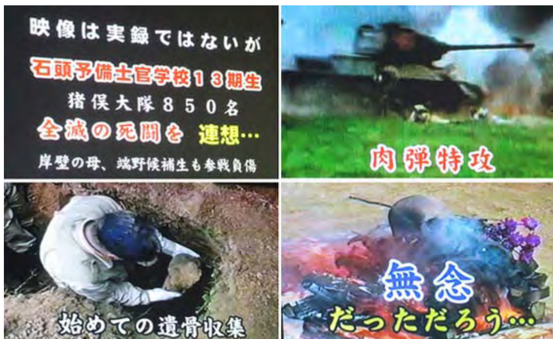
放映されたビデオをカメラで撮影。非常に判りやすく貴重な映像も含まれていました。

氏は、シベリアの遺骨収集にも積極的に参画しており、「今年1月現在で収集されたご遺骨は17,298柱、全体の三分の一に過ぎない」と、政府の怠慢を指摘していた。氏はこの遺骨収集だけでなく、今回のような会合でシベリア抑留の悲劇を風化させてはならない、と講演もさまざまな場所で続けており、朝日・読売・産経新聞などのメディアにも大きく取り上げられている。(ニュース調、ここまで)