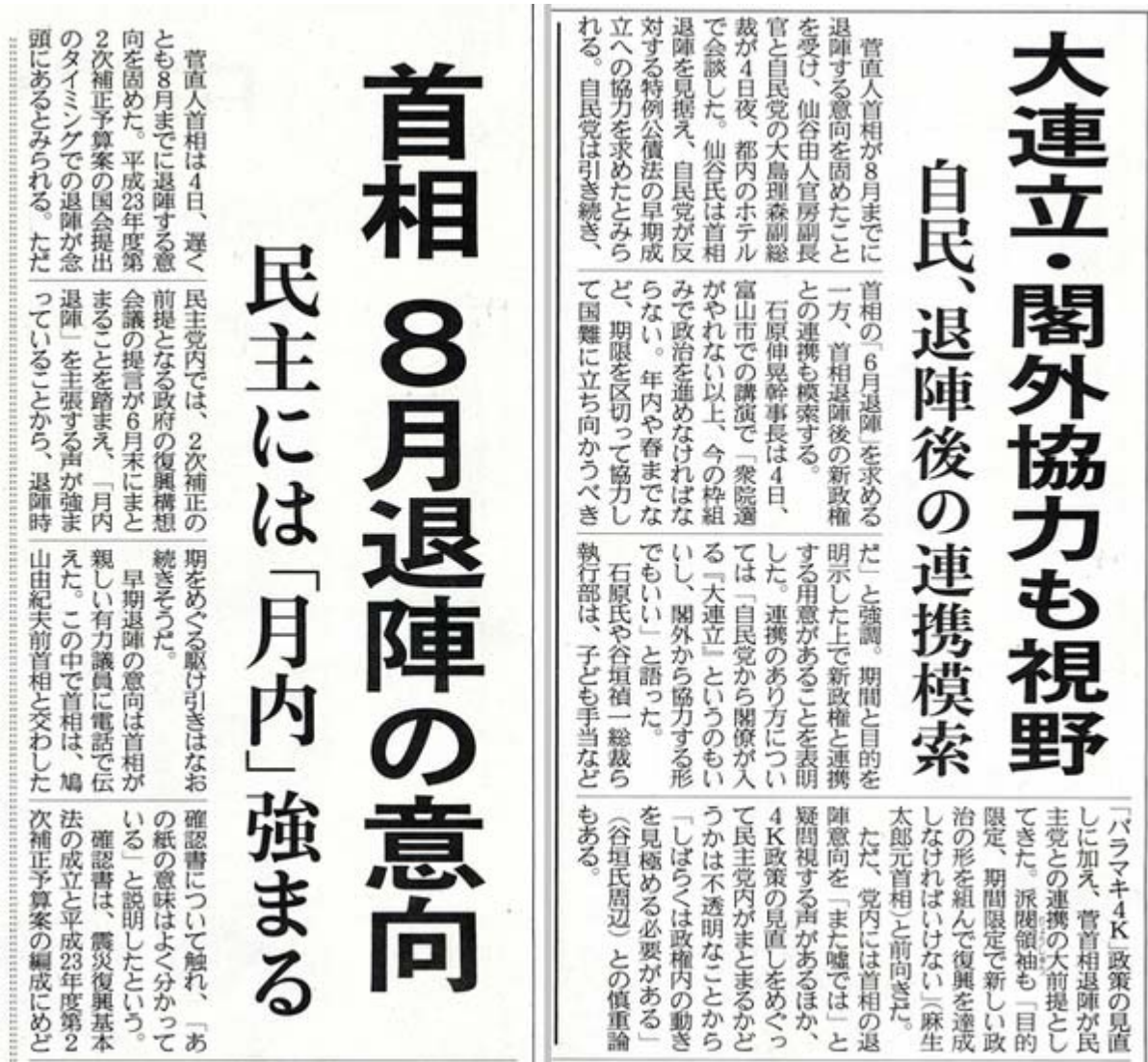
産経新聞6月5日1面(左)と3面(右)の記事、部分スキャン画像 (クリックで3面のネット記事)

早期退陣の意向は首相が親しい有力議員に電話で伝えた。この中で首相は、鳩山由紀夫前首相と交わした確認書について触れ、「あの紙の意味はよく分かっている」と説明したという。(後略、産経ネットから)