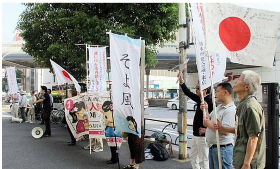
街宣を行った方々、約30人が集まりました。 この日は風が強くて横断幕を持つ人が大変でした。

「極左政権にレッドカード！日本の領土を死守、奪還せよ！」というタイトルの街頭宣伝活動が4日午後、有楽町のマリオン前で開催され、マイクを握った弁士が口々に菅内閣を糾弾、 民主党 政権の危険性を訴えるアピールを行って注目された。