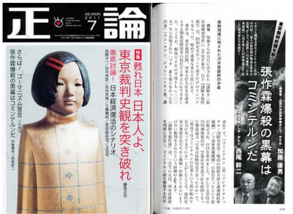
本文が352ページと読み応えのある正論(クリックでHp)