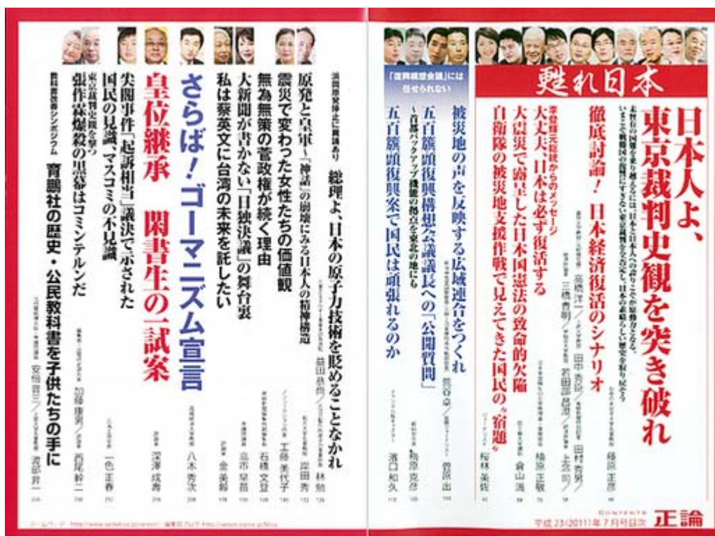
正論6月号目次ページ(クリックでHP)

西尾 この時、張作霖に対して殺意を抱いていた、あるいは排除しようと思っていた勢力なり集団は四つあって、①河本たち日本軍、② 蒋介石 軍のほかに、③ソ連、そして④謀反を考えていた張作霖配下のグループを挙げていますね。