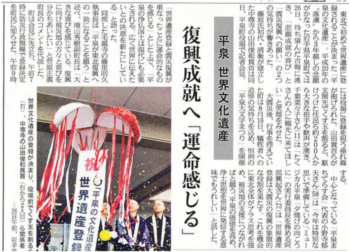
産経新聞6月27日26面の記事スキャン画像(クリックでネット記事)