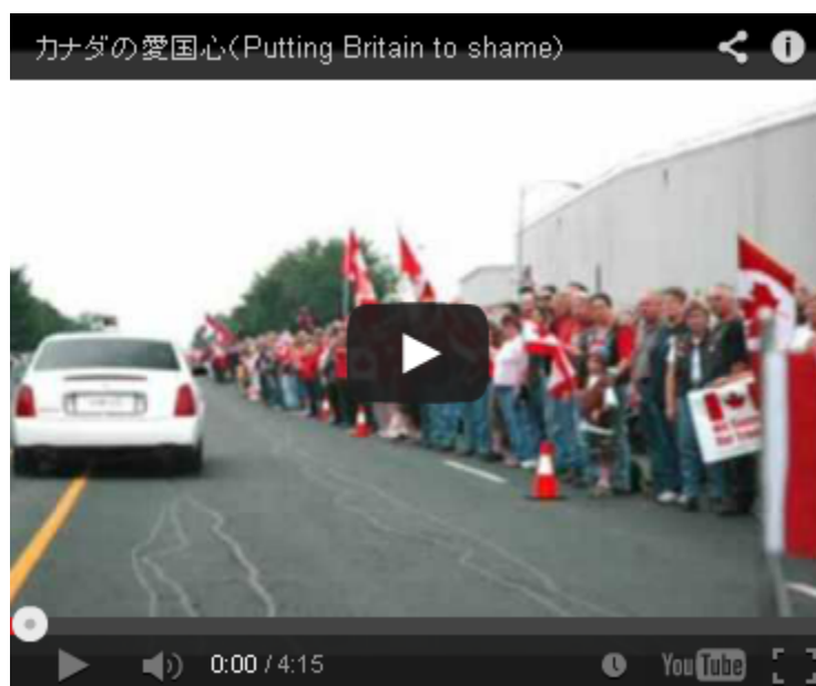
カナダの愛国心(Putting Britain to shame )