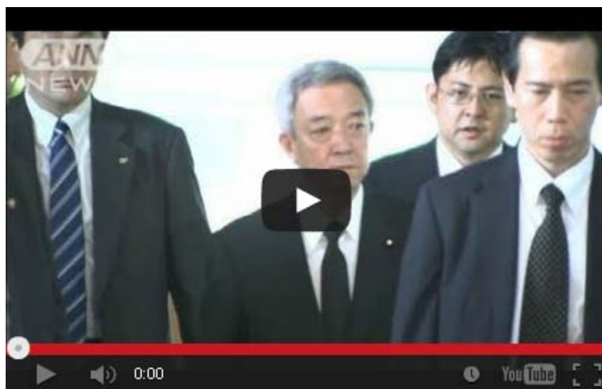
松本復興大臣が辞意表明 菅総理に伝える(11/07/05)