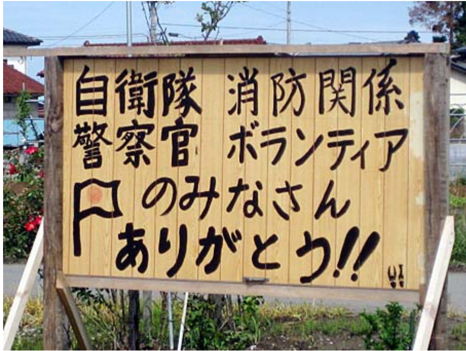
しばりょうさんのサイトから (@SatoMasahisa)

「花うさぎ」ブログの読者で、自衛官に対して何らかの感謝の気持ちを伝えたいとお考えの方が、今、尚、多数居られる事と思いますので、出来れば、告知の機会をお与え頂き、ご賛同者をお集め下されば幸いです。