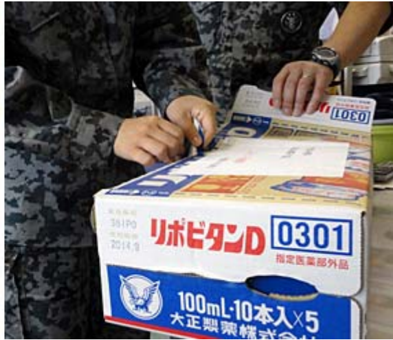
こういうパッケージで贈ってくれています。事務局の皆さんに感謝です。