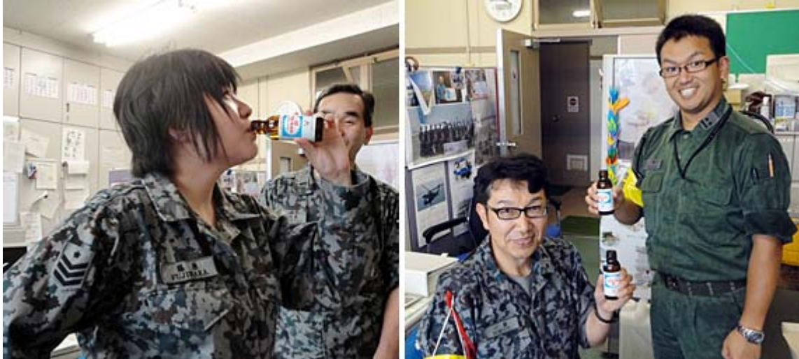
美味しそうに飲んでいる写真を見るとこちらまで嬉しくなります。