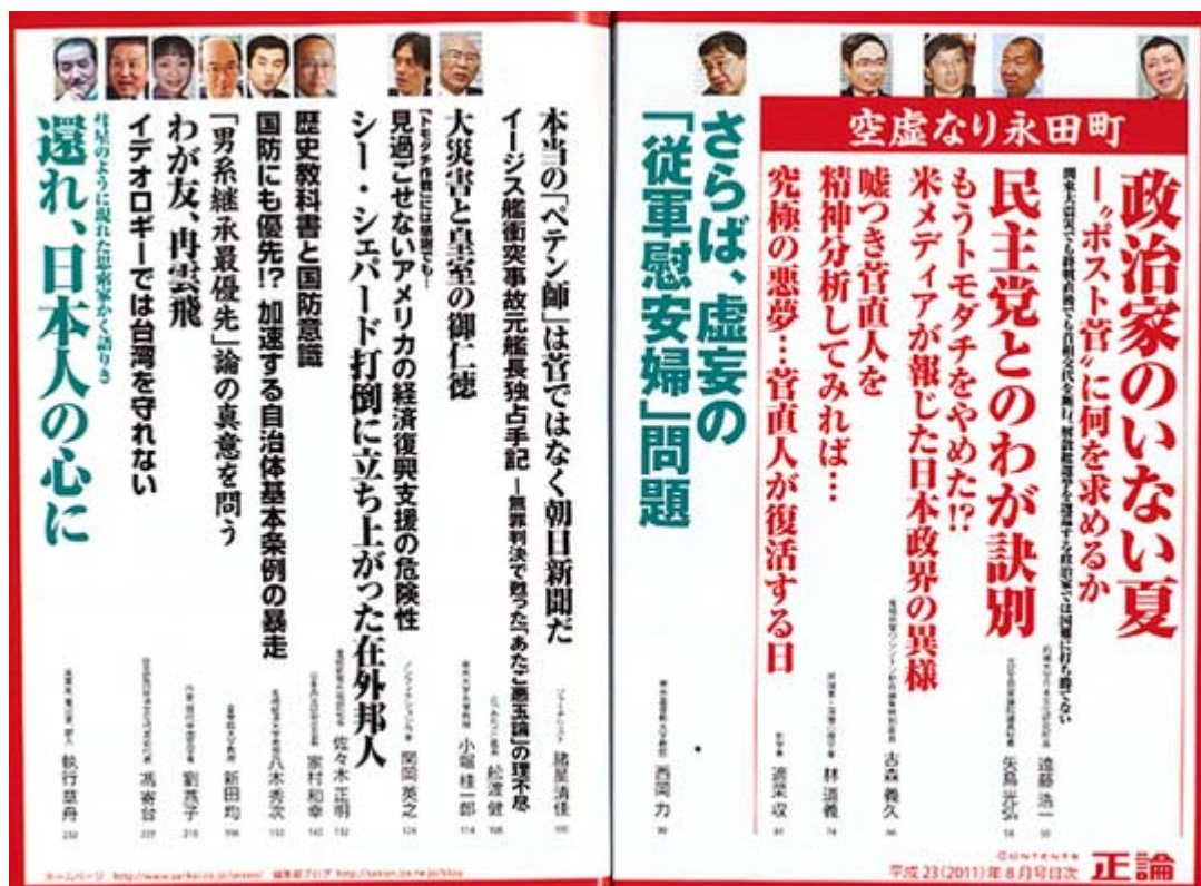
正論8月号目次ページスキャン画像(クリックでHP目次へ)

鳩山首相をも凌ぐ権勢を得た小沢 幹事長 は、党内議論を保証していた 政調 ・部門会議を廃止し、超党派の議連を原則禁止し、党内議連も許可制とし、陳情は全て 幹事長 室を通すよう強要するなど、言論封殺としか言いようのない強権を発動。保守派は活動の場を失いました。