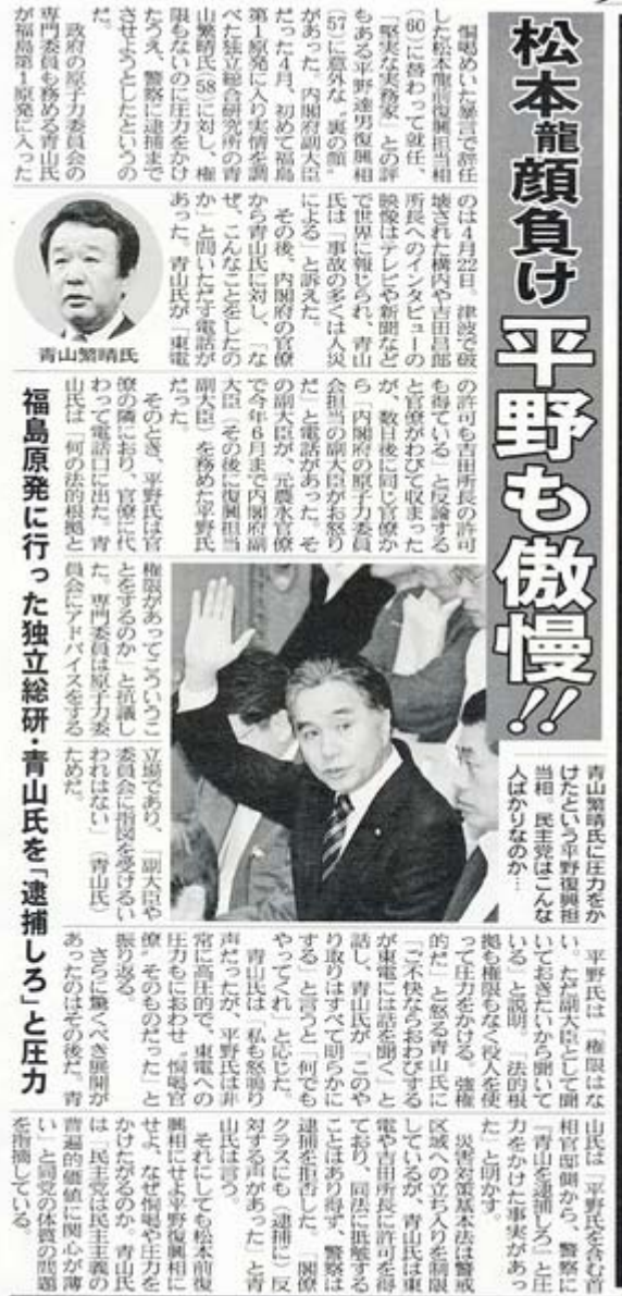
夕刊フジ7月8日2面の記事スキャン画像(クリックでネット記事)