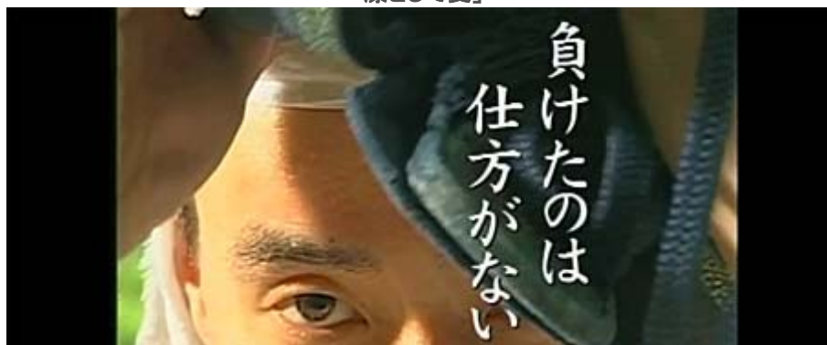
日本がアジアに残した功績