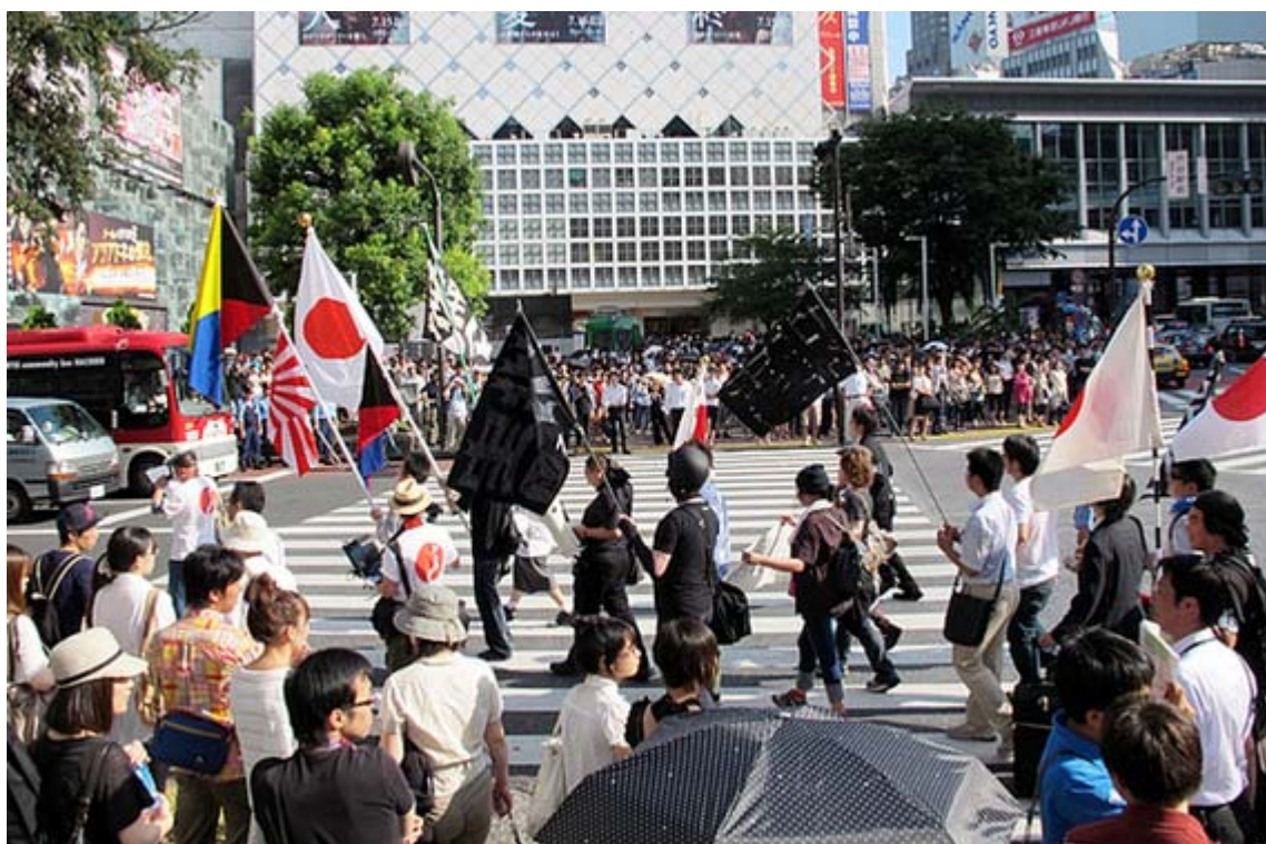
渋谷駅前のスクランブル交差点を行くデモ隊の一行、注目度抜群でした。

これは排害社が呼びかけた「7.9外国人への公金支出全廃を求める国民集会&デモ」で、協賛した行動する保守のメンバー約70人が、思い思いの旗や幟を持参して参加した。中でも黒字に白抜き文字の「排害社」の大きな旗は、日章旗や旭日旗、Z旗とともにデモの先頭で掲げられたが、そのインパクトは大きく、沿道ではある種の「驚き」の表情を持って見つめていた人も多かった。