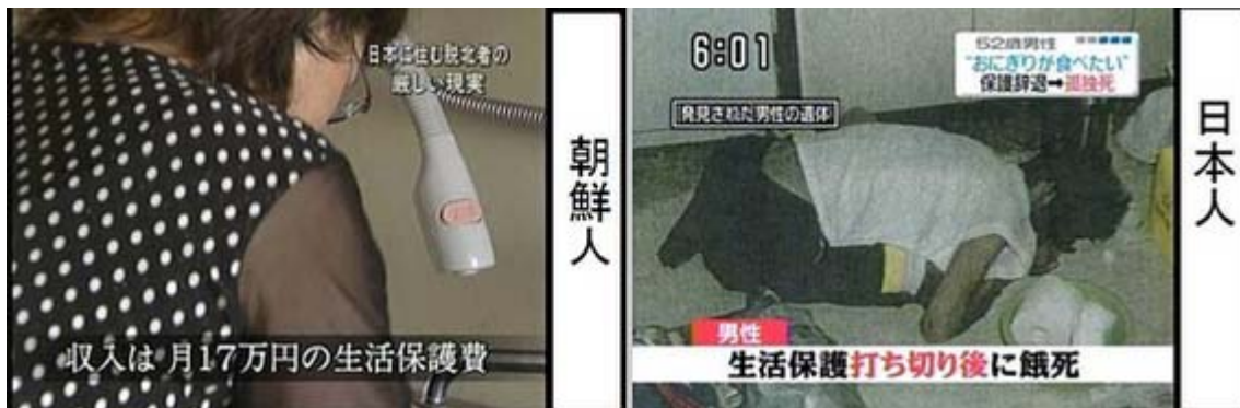
この二枚の画像は外国人には甘く日本人には厳しい生活保護の実態を伝えている。

わけでも、震災の被災者や弱い立場におかれた日本人同胞を路頭に迷わせながら、外国人に莫大な税金を垂れ流し続けている現状は断じて黙過できない事実である。現在、外国人の生活保護受給者は6万人を超え、これは宮城県内で避難所生活を余儀なくされている日本人の数に匹敵し、その支給額は推定1200億円に達するものと見られる。