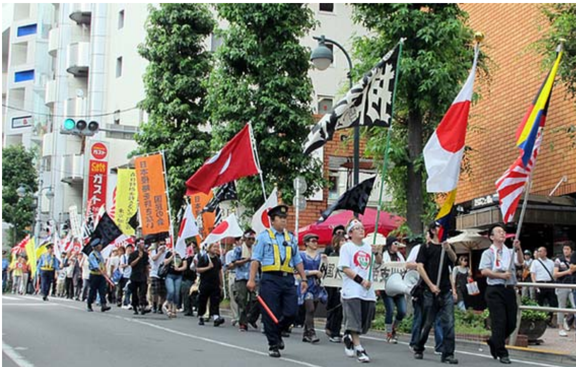
NHK前から公園通りをデモ行進する一行。