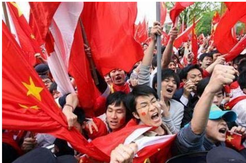
やりたい放題に暴れた支那人留学生。国防動員法が昨年7月から施行されているいま、事態は更に深刻です。

他にも、犯罪で逮捕された外国人が監獄で1人あたり数100万円にもおよぶ手術を受けるなどしている。また外国人学校に支給される学費も同様である。これらは全て日本人の税金でありながら、日本人のためには使われない。日本は一体だれの国なのか!? 我らは国民無視の狂気政治に終止符を打つべく次の通り要求する。