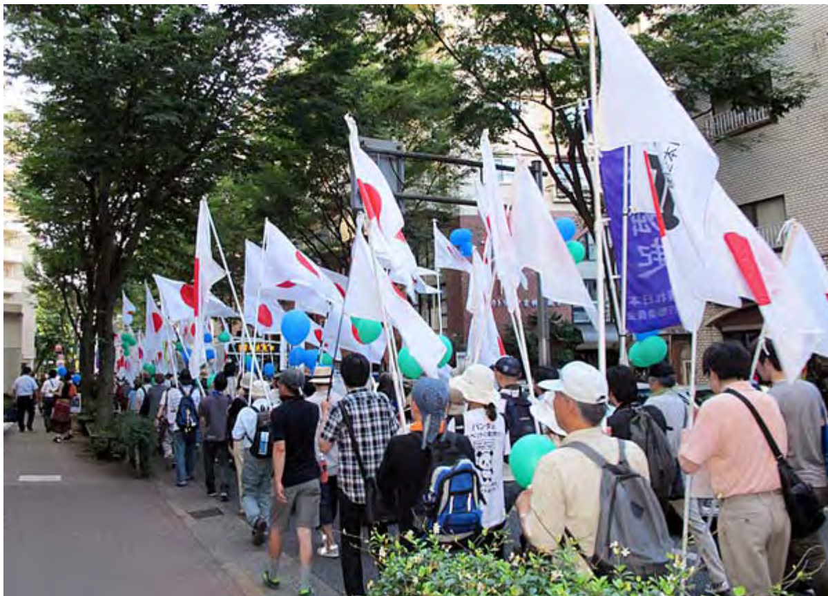
新緑に日章旗の組み合わせは本当に美しいです。