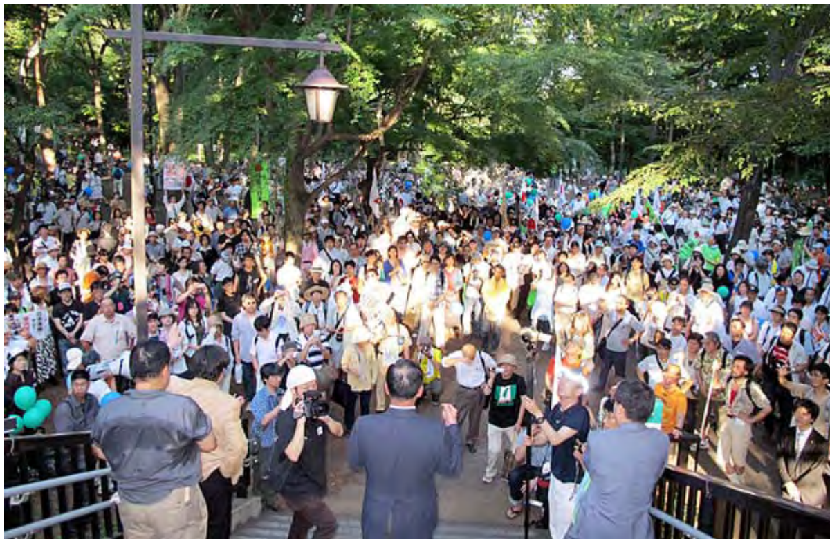
デモ終了後の田母神会長の挨拶、直射日光でうまく撮影できませんでした。