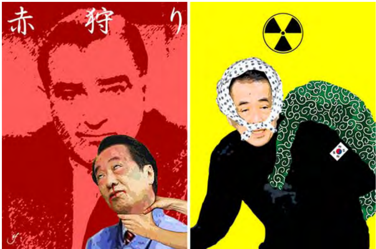
赤狩りだ！亡国の工作員をあぶり出せ！ 菅の謀略！原発潰して韓国に技術流出させる！