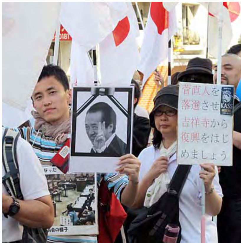
この遺影は素晴らしい！右はよく見ると缶に菅の顔が。

参加された皆さま、暑い中、本当にご苦労さまでした。一番上の写真、公園通りを埋めた日章旗がはためくデモ隊の列のスナップですが、遥か奥まで列が続いているのが確認できるでしょうか。恐らく、吉祥寺はじまって以来の光景だった筈です。実はこのデモの前にまた「反原発」のどんちゃん騒ぎ・反日左翼デモが駅前で行われていたのですが、沿道の人々の注目度は比較にならないほどの差がありました。