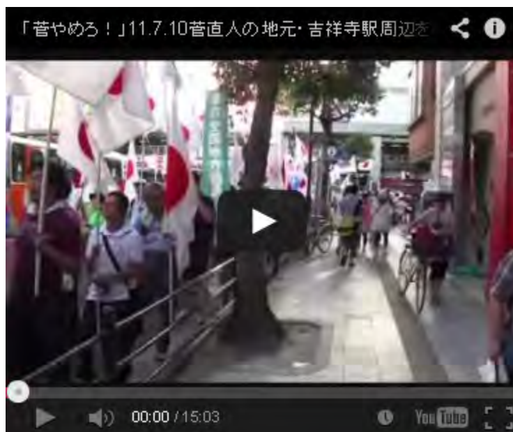
【「菅やめろ！」11.7.10菅直人の地元・吉祥寺駅周辺を取り囲む国民のデモ】