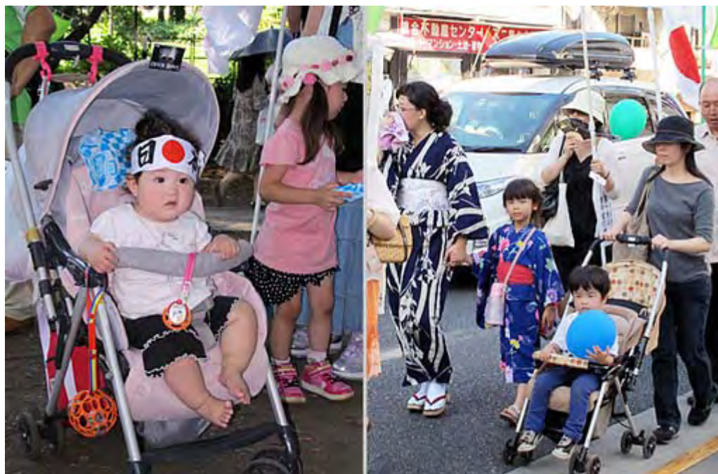
左の日の丸のハチマキの赤ちゃんは10ヶ月 だそうです。 ゆかたの親子、季節感があって良いですね。

参加された皆さま、暑い中、本当にご苦労さまでした。一番上の写真、公園通りを埋めた日章旗がはためくデモ隊の列のスナップですが、遥か奥まで列が続いているのが確認できるでしょうか。恐らく、吉祥寺はじまって以来の光景だった筈です。実はこのデモの前にまた「反原発」のどんちゃん騒ぎ・反日左翼デモが駅前で行われていたのですが、沿道の人々の注目度は比較にならないほどの差がありました。