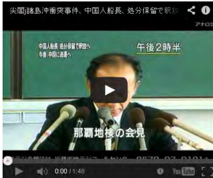
尖閣諸島沖衝突事件、那覇地検記者会見

この審査会のメンバーは、担当地区の有権者から抽選で選ばれ、会議は非公開ですから、本当に素直な民意が表明できる貴重な機会です。四月に出した第一回の議決からメンバーが入れ替わっているにもかかわらず、今回も11人中8人の賛成という条件をクリアして、表題の「起訴相当」を議決してくれました。