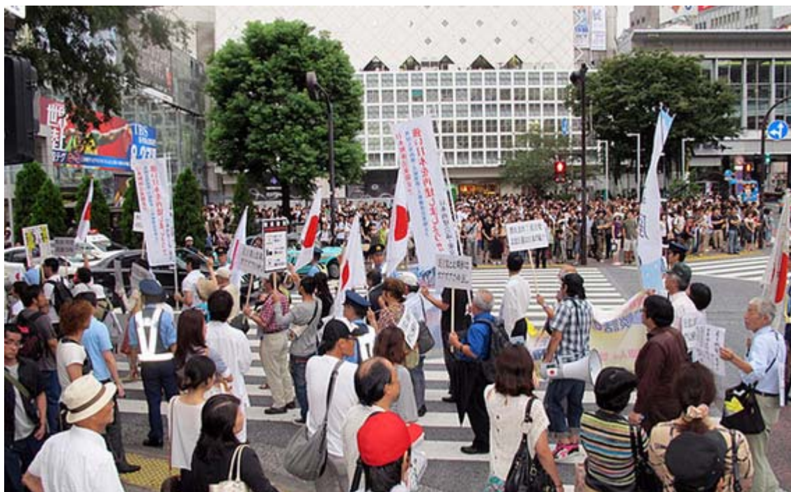
渋谷のスクランブル交差点を通過するデモ隊の一行

デモ行進は何事もなく終わるかと思われたが、終着地点前の宮下公園脇を通過中に、その公園で祭りを実施していた反日左翼が「差別を止めろ！」とマイクで叫んだことから、行進がストップ。在特会の桜井会長がマイクでやり返すなど、一次騒然とした雰囲気にも包まれた。デモが解散したあとも、公園近くを通過すると再び相互の応酬が続くなど、番外のハプニングで盛り上がった。(ニュース調、ここまで)