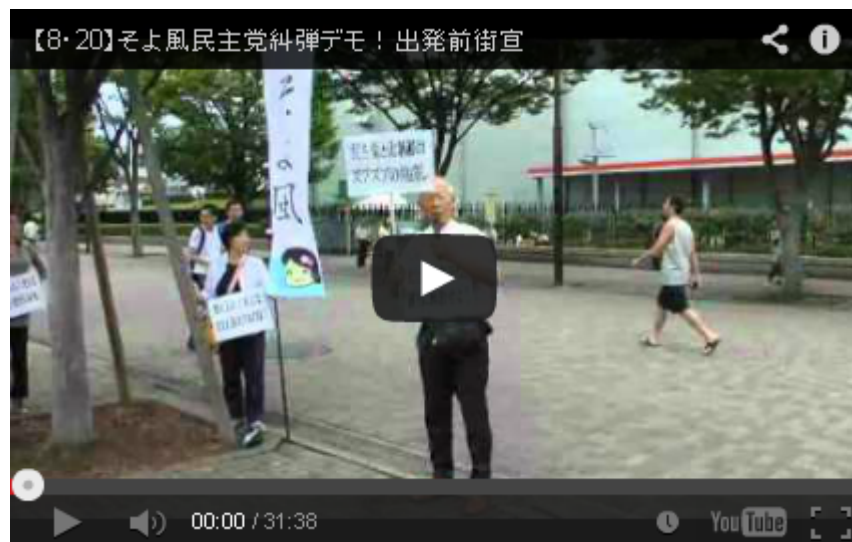
【8・20】そよ風民主党糾弾デモ！出発前街宣

デモ行進は何事もなく終わるかと思われたが、終着地点前の宮下公園脇を通過中に、その公園で祭りを実施していた反日左翼が「差別を止めろ！」とマイクで叫んだことから、行進がストップ。在特会の桜井会長がマイクでやり返すなど、一次騒然とした雰囲気にも包まれた。デモが解散したあとも、公園近くを通過すると再び相互の応酬が続くなど、番外のハプニングで盛り上がった。(ニュース調、ここまで)