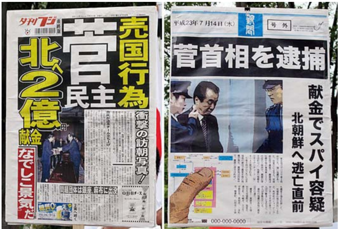
夕刊フジの記事やyohkanさんのイラストもプラカードに

渋谷をご通行中の皆様。こちらは日本を愛する女性の団体、そよ風の民主党抗議デモです。 民主党政権はマニフェストをどれも実行できませんでした。 それどころか日本を解体する法案を次々成立させようとしています。 民主党は巡視船にぶつけた船長を釈放するなど中国共産党の手先となっています。 民主党政権は日本解体をめざす革命政権です、私達は即時解散を求めます。