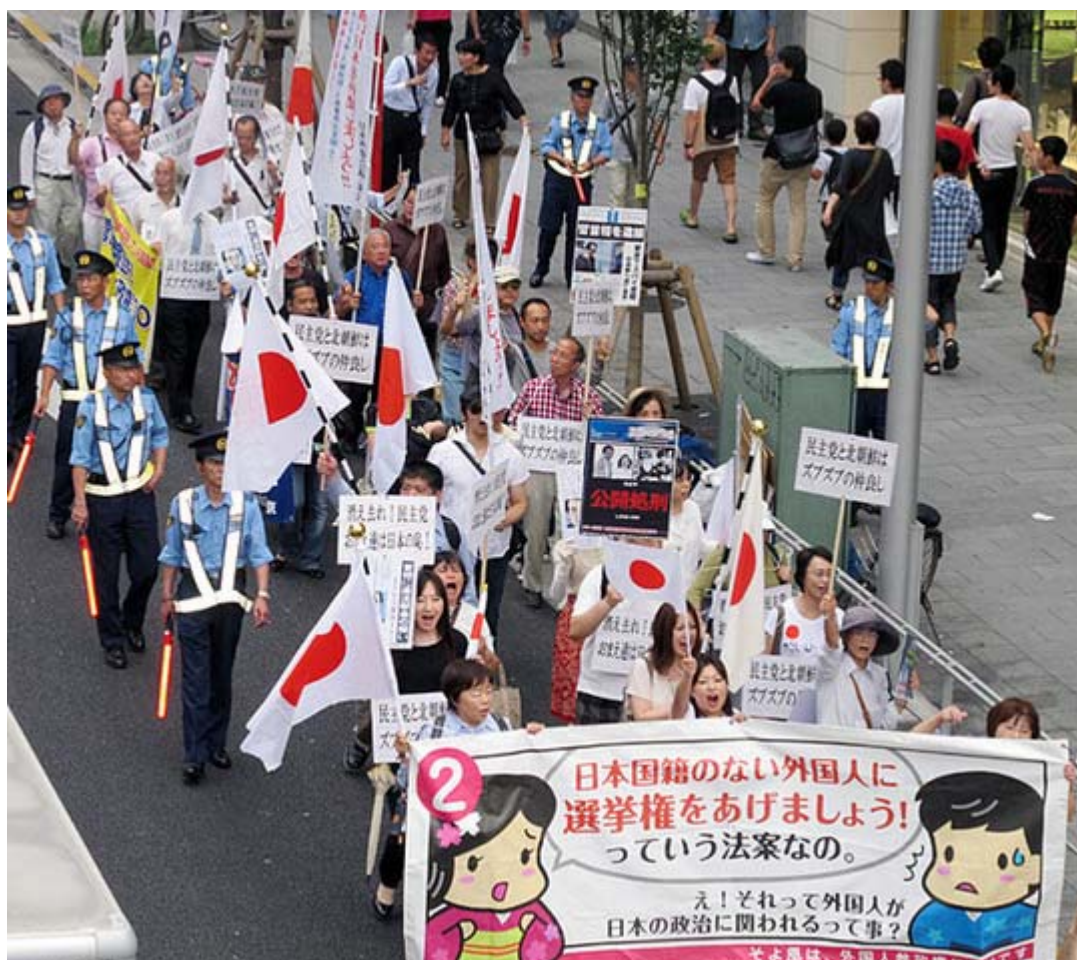
小人数でもみな元気シュプレヒコールを連呼して民主党政権打倒を訴えた。

これはそよ風が主催して呼びかけ、在日特権を許さない市民の会・東京支部、外国人参政権に反対する会・東京、日本再建会議・東京が協賛して実施された「そよ風民主党糾弾デモ！」。代々木公園櫛通り→宇田川町→井の頭通り入口→渋谷駅→宮下公園脇→神宮通り公園という40分のコースだった。