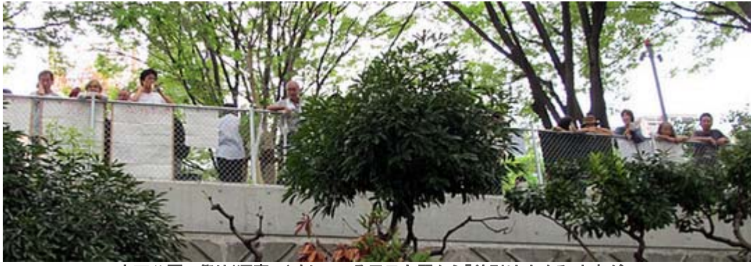
宮下公園で祭り(酒宴?)をしている反日左翼から「差別は止めろ」と声が！