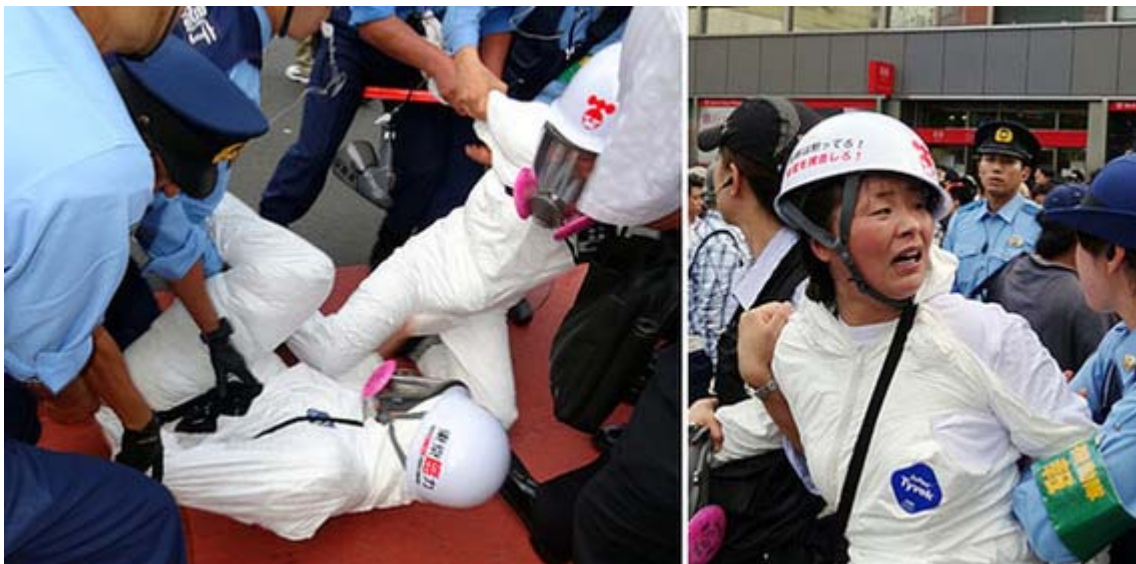
上記記事の逮捕のシーン。二人は夫婦のようで「返してよ、私の旦那！」と大声で泣きながら叫んでいた。 大丈夫 、数日で帰りますよ。

・ニコニコ動画 2011.9.11在特会に抗議しようとした脱原発デモ参加者逮捕の瞬間