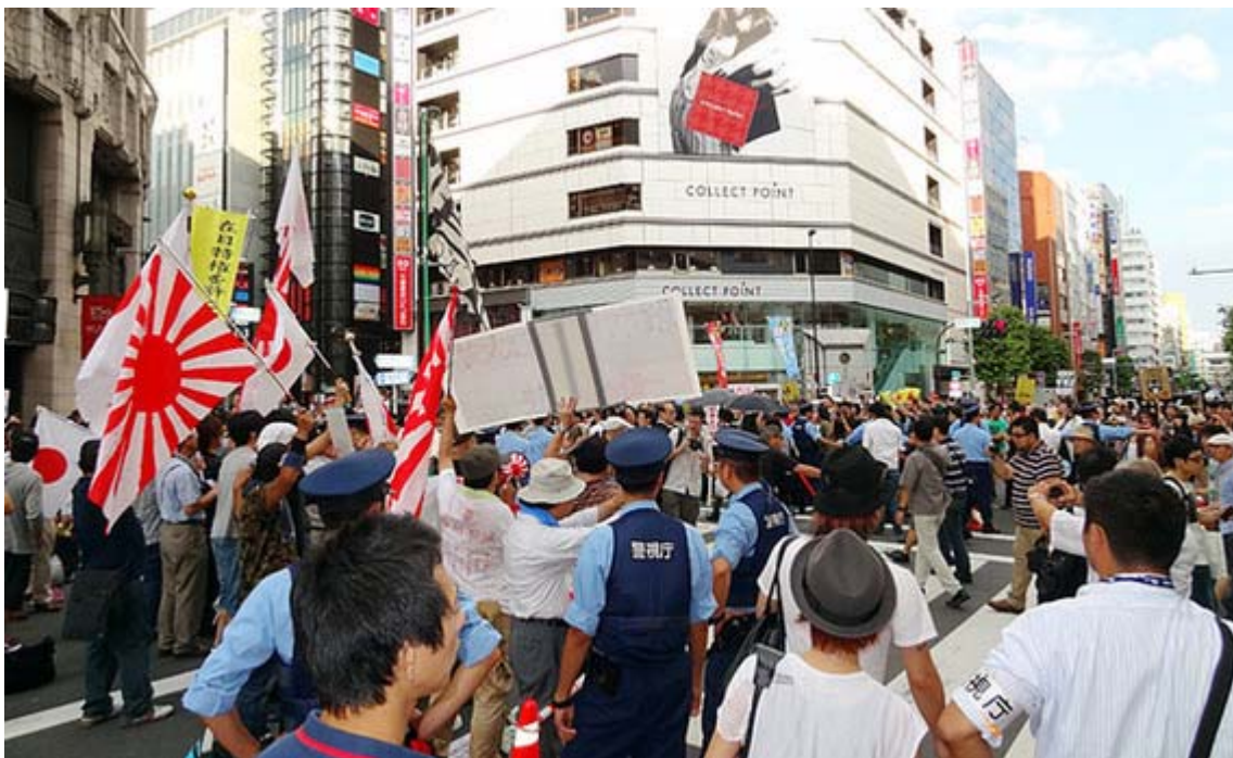
新宿通りと明治通りの交差点、伊勢丹前でデモ隊と抗議団。

驚いたのは、デモ隊が到着するころから、参加者らしい人たちが歩道でもかなり移動していたり、酒を飲んでいて辺りが酒臭い臭いがするなど、「オイオイ、デタラメやっているな」という印象を持ったことです。相変わらず在日や左翼・労組の参加者が目立ちましたが、白人系外国人の姿も多く、やたらカメラで抗議団を撮影していたのが印象的でした。