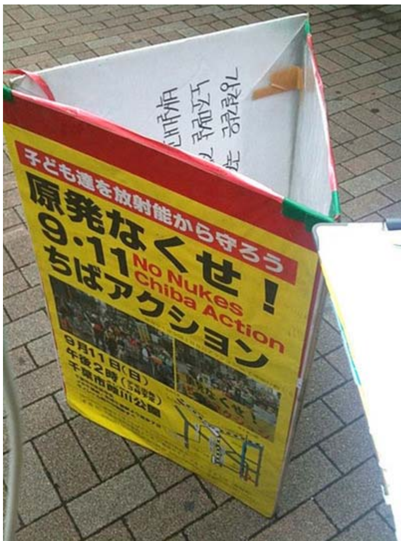
反原発の正体ってこれなの？ (画像はネットから引用)

参加された皆さま。お疲れ様でした。いや～第一印象は、反・脱原発デモの参加者がガクッと減った、ということでした。事実上、高円寺からはじまった反・脱原発デモ、一時は凄い勢いで全国に拡がりましたが、節電も終わってブームが過ぎたということでしょうか。