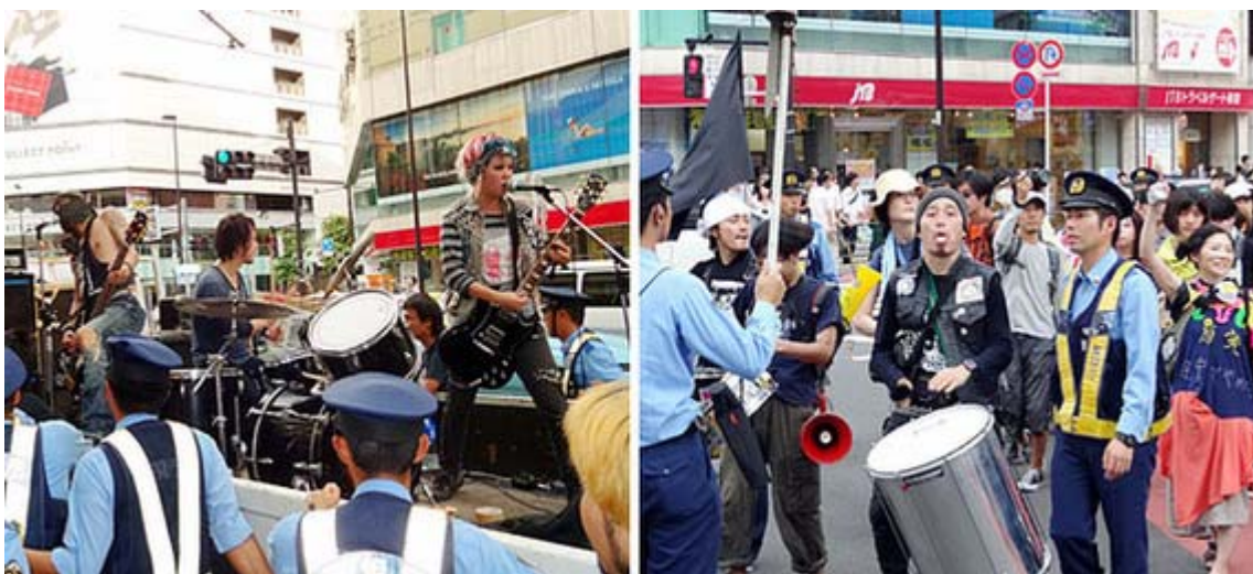
品の悪いカーニバルのよう。太鼓の男は抗議団にご覧の表情。

中には抗議団にペットボトルをふって水をかけたり、朝鮮の民族衣装を着た叔母さんがしつこく言いがかりをつけたりと、警察官や公安が度々間に入るケースが起きました。一番下の写真、放射能の防護服のような衣服を着た二人が、警察官の制止を聞かずに抗議団に迫ろうとして身柄を確保された瞬間です。この二人は夫婦だったようで、大声で泣きながら「返してよ！私の旦那」と叫んでいましたが、警察の指示に従わずに突っ込む以上、その程度のリスクは覚悟しているのかと思ってましたが、ビックリしたようですね。警察発表もあったせいか、メディア各社が逮捕者続出のニュースを配信していました。