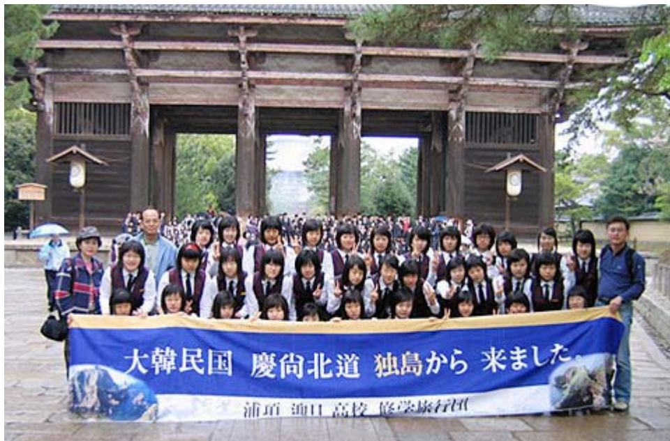
韓国からの修学旅行受け入れは、 政治活動禁止 を条件にすべきだ。

・ついでに そよ風さんのサイトから借りた画像 が、この写真だ。韓国の高校生が日本に修学旅行に来て、著名な神社仏閣の前で記念写真を撮影する際に、「独島は我が領土」という政治的メッセージをこめた横断幕を掲げる行為だ。ふざけた話である。これを許可する政府や行政も問題だが、このシーンをみた日本人で、注意や抗議をする人がどの程度いるのだろうか？という我々自身の問題でもある。