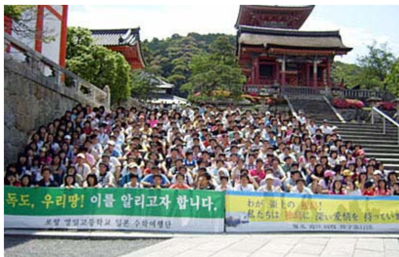
こちらはハングルと日本語の二枚を持参して撮影している。

・これが許されるなら、日本から 韓国 に行く修学旅行生も、同じことをしたら 韓国 側がどのような反応を示すか、考えてみるべきだ。と思ったら、現実とは全く逆で、捏造された従軍慰安婦のお婆さんの前で、日本の学生が頭を下げて謝っていると言うニュースを見た記憶がある。この手の旅行を企画するのは反日左翼の日教組系の教師と相場は決まっているが、こうして日本の若者はどんどん自虐史観に染められていく。