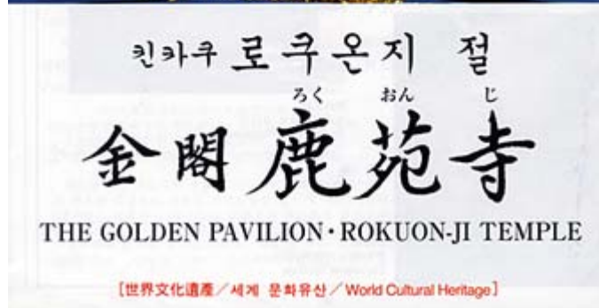
ハングルが日本語より上にきているパンフレット

・「窓口の中から入場券とパンフレットをポンポンと放り投げるように出しているではありませんか。(中略)。窓口の中から、作務衣を着ているお坊さんのような人が『差別だ! 差別するんじゃない!』と怒鳴り声をあげていたのです」。ブログに書かれているこ