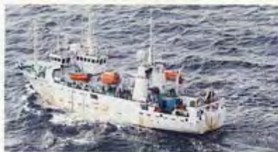
7日に確認された中国の海洋調査船「北斗」