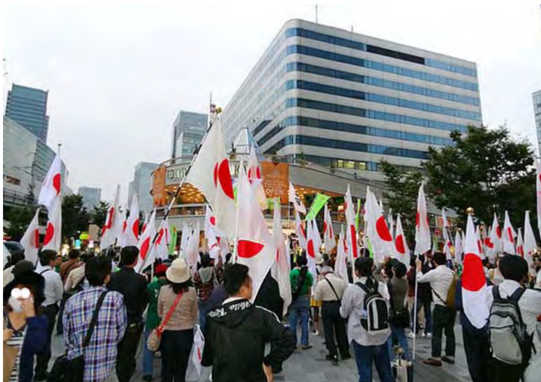
有楽町イトシア前広場での街頭宣伝活動のスナップ

このあと、日章旗やプラカードを置いて、有志がフジテレビ本社内を散歩するという意表を突いた行動に移り、「反日親韓国、フジテレビ糾弾」と染めた緑色のTシャツを着たメンバーも社内を練り歩き、無言の抗議を行った。抗議陣はこの後、有楽町駅前のイトシア前広場に移動、午後七時過ぎまで街頭宣伝活動を行った。(ニュース調、ここまで)。