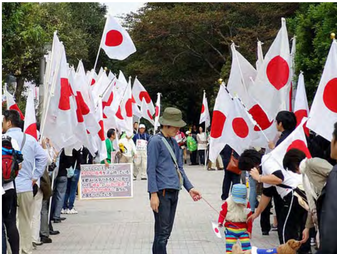
フジテレビ本社前を埋めた抗議陣の日章旗。子どもとワンちゃんも可愛い。

極端な「 韓国 上げ日本下げ」の偏向報道を続けてきたフジテレビに、その是正を求める関連抗議行動が三ヶ月目に入った。8日、頑張れ日本！全国行動委員会はフジテレビ前と有楽町駅前での抗議の街頭宣伝活動(200人以上が参加)を、名古屋では「第三回東海テレビに抗議するオフ」(18人参加)が行われ、街頭宣伝とチラシ配布活動が実施された。