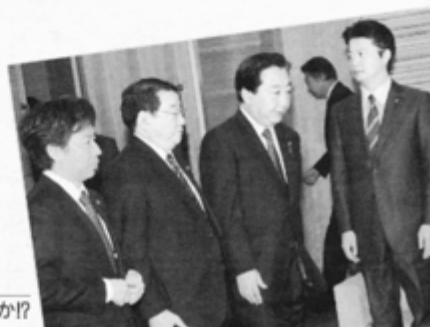
暴言外相は大丈夫か?!

「そもそも、沖縄は米軍に占領されているようなもん。普天間の問題を解決するためには、アメリカを追い出すしかない。それで、中国が尖閣を欲しいと押し出してくれば、尖閣も中国にさし上げればいい」