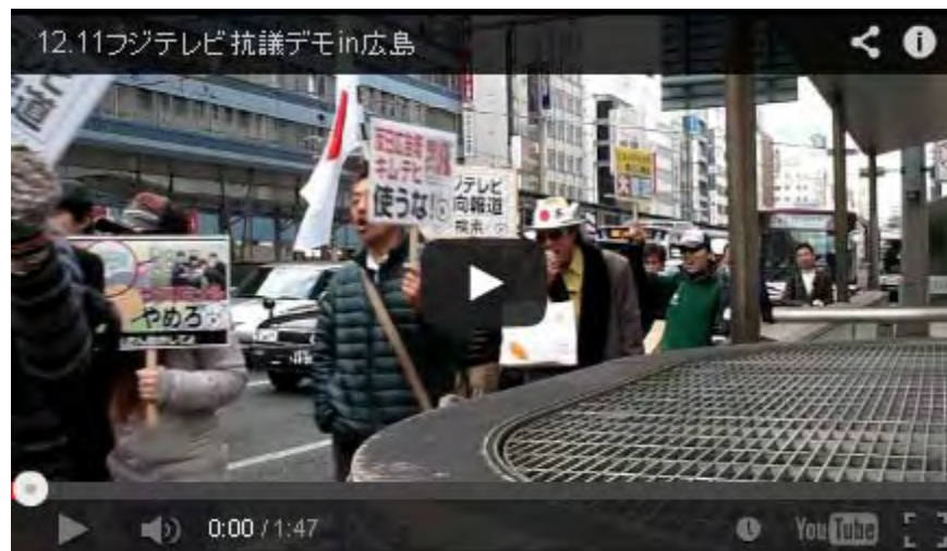
12.11フジテレビ抗議デモin広島