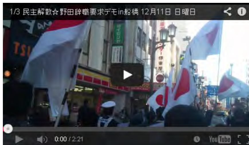
民主解散☆野田辞職要求デモin船橋 12月11日