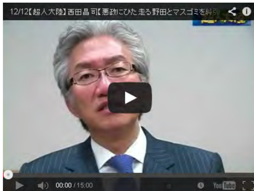
【超人大陸】参議院議員 西田昌司 2011.12.12